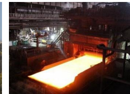
JFEスチール西日本 製鉄所倉敷工場