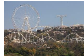
鷺羽山ハイランド