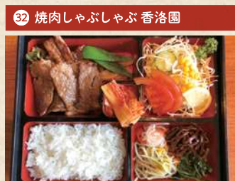
ランチいただきます特別弁当 2,000円(税別)

住 倉敷市阿知 2-19-3 [予約不要] 電 086-422-1282 時 11:00~14:30(OS 14:00) 休 第2・4木曜 Pなし TI折衷 1日限定15食