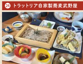
武野屋本店蕎麦御膳 2,000円(税別)

住 倉敷市本町 5-27 [予約不要] 電 086-427-0122 時 11:00~15:00(OS 14:00) 休 月曜(監日の場合は翌日) Pなし TI折衷 1日限定20食