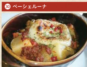
和牛グラタンランチコース(前菜・パスタ・パン・サラダ・コーヒー付) 2,000円(税別)

住 倉敷市中央 1-5-13 [予約不要] 電 086-422-3600 時 11:30~14:30 休 水曜 Pあり TI洋 1日限定20食