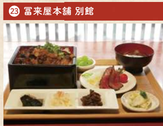
千屋牛の焼肉重ランチ 2,000円(税別)

住 倉敷市本町 6-21 [要予約(前日まで)] 電 086-427-0122 時 11:00~15:00(OS 14:00) 休 月曜(祝日の場合は翌日) Pなし TI和