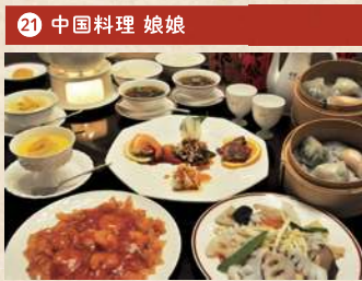
娘娘特製ランチコース 1,500円(税別)

住 倉敷市中島 2370-27 [予約不要] 電 086-465-9676 時 11:30~15:00(OS 14:00) 休 なし Pあり TI中華 2名~注文可