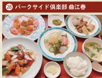
お昼のミニコースランチ 1,500円(税別)

住 倉敷市新田 3219-3 [要予約(前日まで)] 電 086-441-7720 時 11:15~15:30(OS 15:30) 休 木曜 Pあり TI洋 1日限定15食