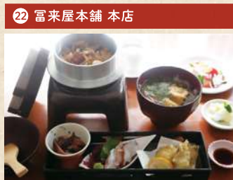
下津井蛸のピクリ釜飯ランチ 2,000円(税別)

住 倉敷市中島 2370-27 [予約不要] 電 086-465-9676 時 11:30~15:00(OS 14:00) 休 なし Pあり TI中華 2名~注文可