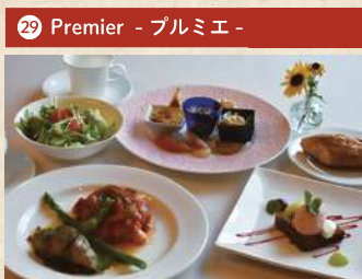
メイン2種類の贅沢グルメランチ(岡山県産の魚と肉) 2,000円(税別)

住 倉敷市中庄 3126-8 [要予約(前日まで)] 電 086-463-7733 時 11:00~14:00 休 月曜 Pあり TI中華