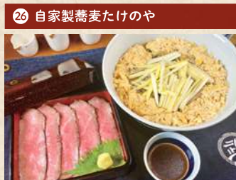
黄ニラ玉子とじの新そばとローストビーフ重セット 1,500円(税別)

住 倉敷市下庄 473-3 [予約不要] 電 086-464-0101 時 11:00~14:30(OS 14:00) 休 水曜 Pあり TI和 1日限定20食