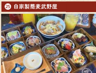
ランチいただきます限定おばんざいランチ 2,000円(税別)

住 倉敷市阿知 3-18-18 [予約不要] 電 086-441-2983 時 11:00~14:30(OS 14:00) 休 水曜 Pあり TI和 1日限定10食