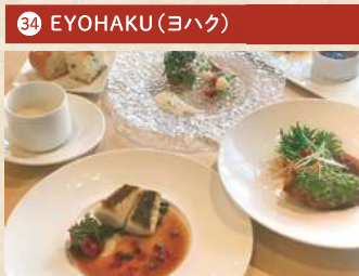
EYOHAKU ランチ 2,000円(税別)

住 倉敷市中央 2-1-18 [予約不要] 電 086-427-3100 時 11:30~14:00 休 なし Pあり TI和