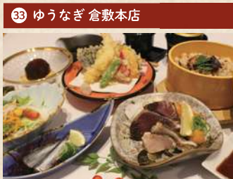
薬焼きと瀬戸の幸御膳 2,000円(税別)

住 倉敷市黒石 1146-5 [予約不要] 電 086-426-1129 時 11:00~14:30(OS 14:30) 休 第2・4水曜 Pあり TIその他 1日限定20食