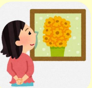
美術館入館券& ガイド付プラン