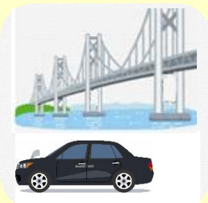
観光タクシー付 プラン