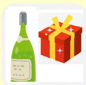
地域のおみやげ付 プラン