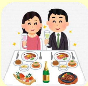
こだわりのお食事 プラン