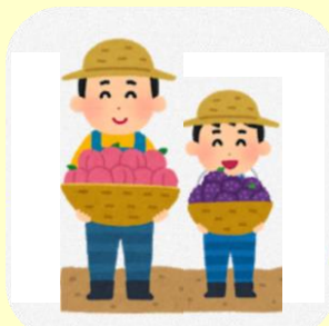
農業体験付プラン