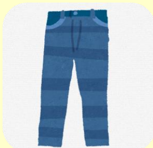
特産品購入プラン