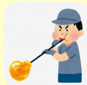
ものづくり体験付 プラン