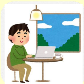
ワーケーション・ テレワークプラン