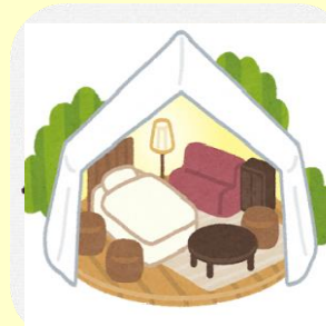
グランピングで自然に 癒されプラン