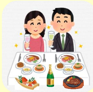
ちょっと豪華な食事付 プラン