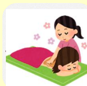
マッサージ付 癒されプラン