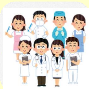
医療・福祉・介護 従事者向けプラン