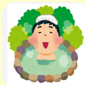
温泉でのんびりプラン