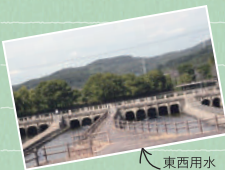
東西用水酒津樋門

園内には約500本のソメイヨシノやヤエザクラが咲き誇り、のんびり散歩を楽しむことができます。