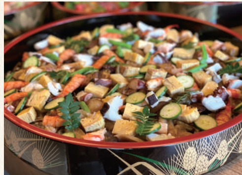
バラ寿司は事前の予約が必要です。