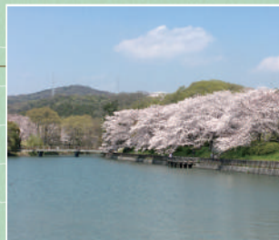
桜の時期の酒津公園

昭和26年に高梁川改修事業により生じた土地に開設された総合公園です。以来60年間、四季折々の季節を通じて市民に親しまれてきており、この貴重な空間をより魅力的で快適な公園として楽しんでもらえるよう、「水と桜」をテーマに整備されてきました。また、日本最大級の樋門「東西用水酒津樋門」は、大正13年に完成してから現在も活用されており、国の重要文化財にも指定されています。