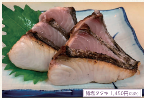
鯖塩タタキ 1,450円(税込)

モダンな外観の一軒家。扉の向こうの開放感溢れる店内は、ワイワイとした雰囲気があるで和風ビアホール! 年齢層も幅広く落ち着いた年代の方から若い方まで楽しめます。駄々自慢のビール4種類と旬の素材をご堪能ください。