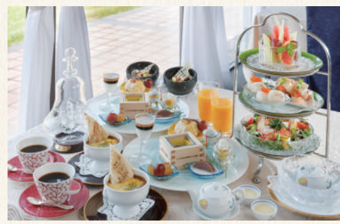
※写真は2名分(1人前3,500円)のイメージです。