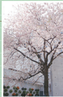
阿知フラワーポッケ!

倉敷美観地区入り口付近、阿知フラワーポッケにある1本の桜の木。ヒマラヤ桜という種類で、寒い時期(12月~1月)にほんのりピンク色の花を咲かせます。冬に咲く桜は、めずらしいので、道を歩く人も足を止めて思わず見入ってしまいます。この時期に咲く桜の鑑賞に倉敷美観地区へお越しください。四季折々の表情を持つ倉敷の町を散歩してみたいかでしょうか。