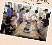
塩づくり体験ができます(要予約)