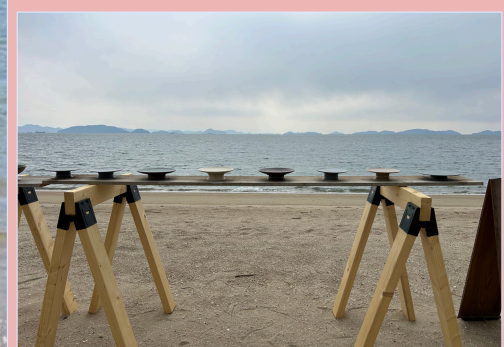
うつわの展示販売