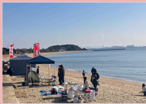
マルシェイベント